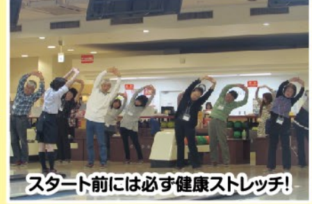
スタート前には必ず健康ストレッチ!