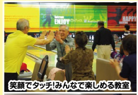
笑顔でタッチ!みんなで楽しめる教室