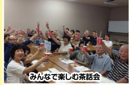
みんなで楽しむ茶話会